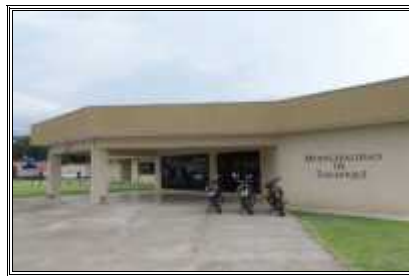
Edificio Municipal, Sarapiquí